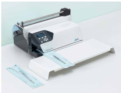
Table à instruments et station Hygofol pour l'installation sur table

Souder à l'aide d'un système complet : Avec les accessoires et les sachets d'emballage du système Hygopac, vous réalisez votre travail avec succès. Hygopac Sealcheck, le test de soudure, permet de contrôler chaque jour la qualité de celle-ci, en un clin d'œil. Cela contribue ainsi à encore plus de sécurité.