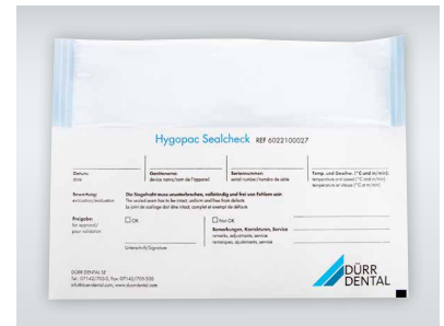
Hygopac Sealcheck, le test de soudure quotidien